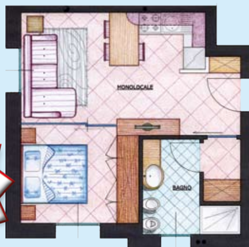
Appartamento Tipo Y

Alta Qualità & Tecnologia all'avanguardia