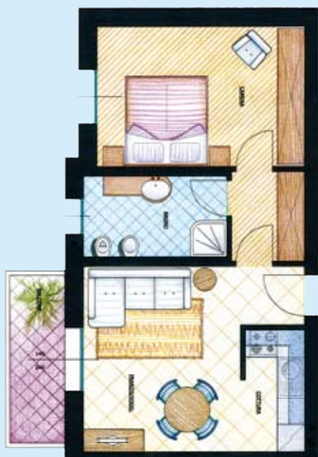
Appartamento Tipo B

In questo modo l'Impresa Roversi vi garantisce la realizzazione di un fabbricato a basso consumo energetico "certificato", tenendo ben presente che la maggiore fonte di energia è l'efficienza energetica del fabbricato stesso e che vivere in modo confortevole consumando meno energia, fa bene all'ambiente e al portafoglio.