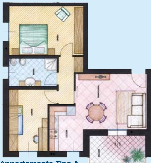
Appartamento Tipo A

Gli appartamenti saranno costruiti in modo da ottenere la certificazione CASACLIMA®. Pertanto il costo di riscaldamento annuale dei singoli appartamenti sarà inferiore a 300,00 Euro !!